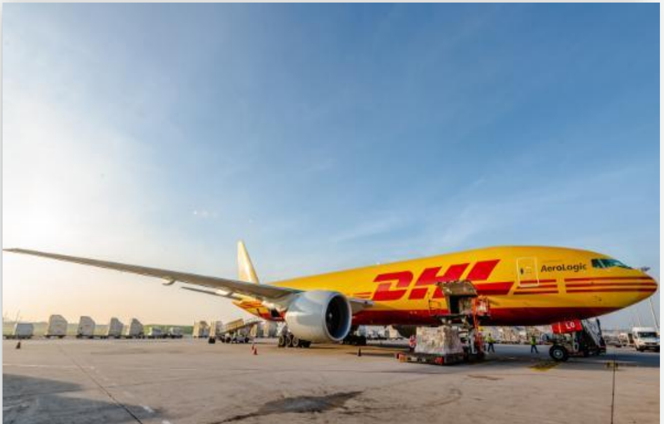
Máy bay của DHL

Lý giải về sự sụt giảm này, tập đoàn cho biết do ảnh hưởng từ sự thay đổi lớn trong nhu cầu trao đổi hàng hóa giữa Châu Á vs Mỹ và Châu Á vs Châu Âu.