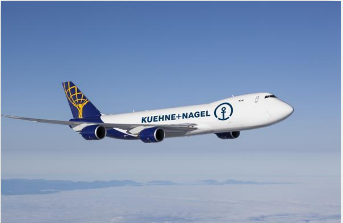
Ảnh minh hoạ

Tuy nhiên, ngành cũng có nhiều dấu hiệu tích cực khi doanh thu và lợi nhuận của các hãng giao nhận tăng thêm, điều này xuất phát từ việc giá cả tăng làm giảm đi hiệu ứng của sụt giảm nhu cầu