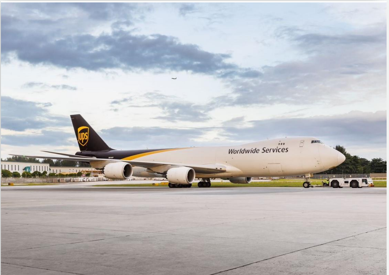
Máy bay chuyên chở của UPS

Cụ thể, doanh thu gộp của UPS trong Quý 2/2023 là 22,1 tỷ USD, giảm tới 10,9% so với Quý 2/2022.