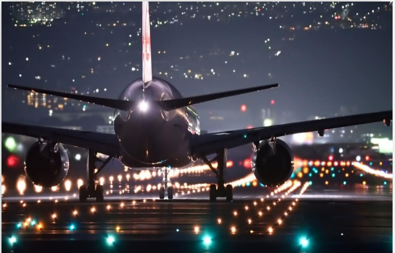
Ảnh minh hoạ

Số liệu về sản lượng hàng hoá giảm xuống mức thấp nhất kể từ tháng 2/2022 và so với mức giảm 8,1% trong 6 tháng đầu năm.