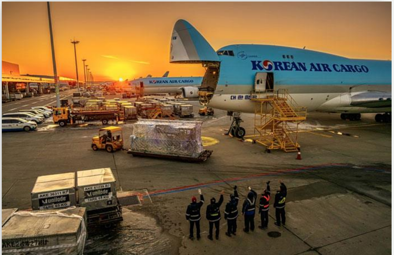
Ảnh minh hoạ

Hãng hàng không này cho biết vận đơn hàng không điện tử sẽ thay thế hình thức giấy tờ vật lý truyền thống cho hàng hoá rời khỏi Hàn Quốc tới Bắc Mỹ, Châu Âu, Nhật Bản và những thị trường được lựa chọn khác.